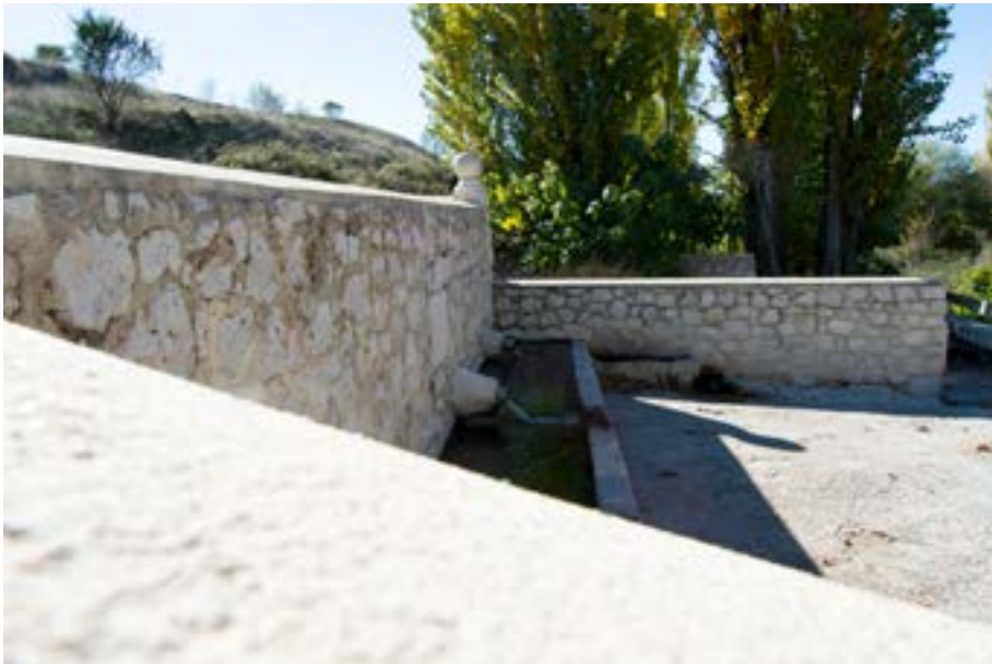
Fuente Grande. Corpa