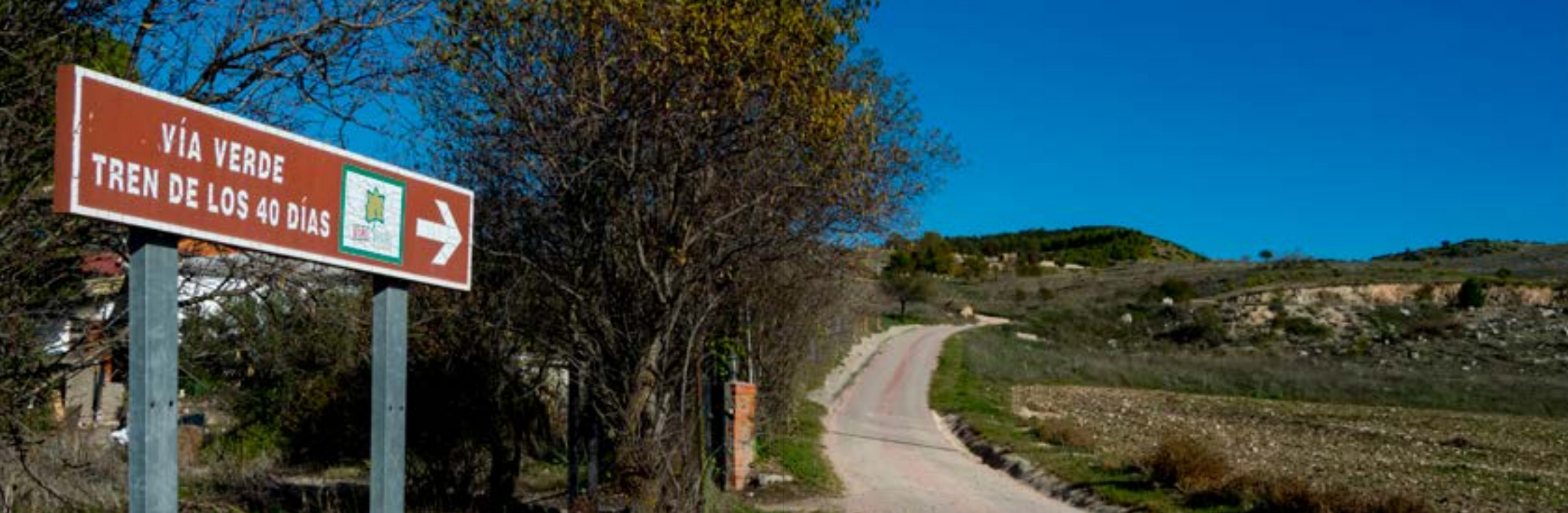
Vía Verde. Carabaña.