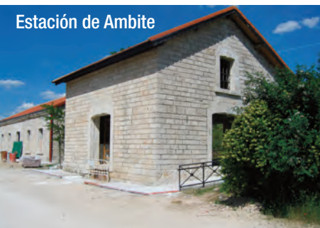
Estación de Ambite

Km. 35. A punto de llegar a Carabaña veremos que a la derecha tenemos una muy interesante opción para seguir pedaleando, esta vez por la conocida como Vía Verde del Ferrocarril de los Cuarenta Días, un ramal ferroviario trazado durante la Guerra Civil. Este ramal tiene 14 kilómetros y nos dejaría en la localidad de Estremera. La Vía verde del Tajuña continúa por el valle de este río en donde veremos cada cierto tiempo viejos molinos movidos por la corriente del agua.