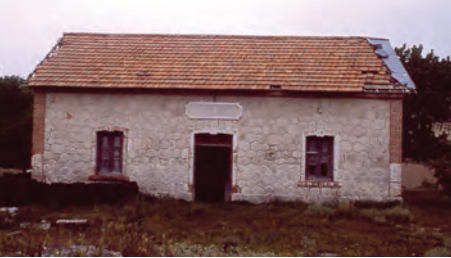
Estación de Chavarri

Km. 30. hace un buen rato que hemos dejado atrás el casco urbano de Tielmes así como una pequeña ermita junto a la ruta. Mas adelante y junto a la carretera es posible ver el edificio de la antigua estación de Chavarri que daba servicio al balneario y planta embotelladora de las célebres “Aguas de Carabaña”.