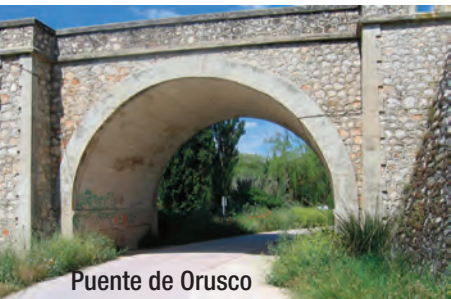
Puente de Orusco

Km. 30. hace un buen rato que hemos dejado atrás el casco urbano de Tielmes así como una pequeña ermita junto a la ruta. Mas adelante y junto a la carretera es posible ver el edificio de la antigua estación de Chavarri que daba servicio al balneario y planta embotelladora de las célebres “Aguas de Carabaña”.